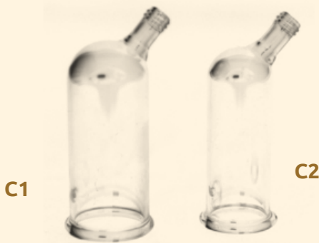
C1 gerades Glas 4cm

hier verwendet man ein gerades Glas und ein Körperglas in Kombination.