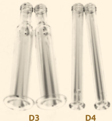
D4 Gesichtsglas gerade 1cm