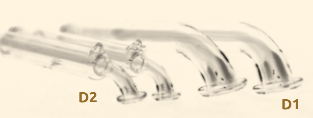
D1 Gesichtsglas gebogen 2cm

Für die Gesichtsbildung verwendet man 2 Gläser und arbeitet synchron. Um die Augen und auf den Lippen verwendet man die Löcher im Glas zum „blopfen“. Indem man das Loch schnell auf und zu macht, pulsiert man oberhalb und unterhalb der Augen und auf den Lippen.